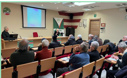
La riunione organizzata dai pensionati Cisl della zona di Cuneo sul tema del mercato libero di luce e gas lo scorso 14 dicembre

Da mercoledì 10 gennaio i clienti del gas ancora legati al mercato a maggior tutela devono obbligatoriamente passare al mercato libero. Questo passaggio obbligatorio non riguarda i clienti considerati vulnerabili e dunque: soggetti con disabilità con legge 104; chi ha età superiore ai 75 anni; chi percepisce un bonus e dunque ha una condizione economica svantaggiata. Queste tre categorie possono restare nel mercato tutelato. Per